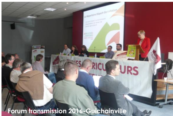
Forum transmission 2016 - Guichainville