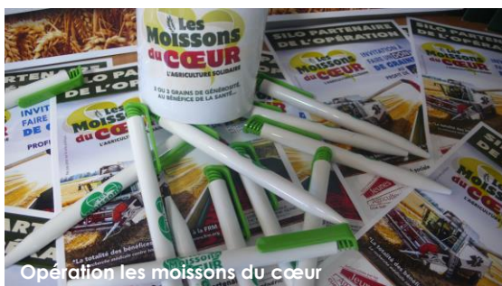
Manifestation à Rouen-28/01/16

Les JA départementaux sont eux-mêmes regroupés en une structure régionale JA Normandie qui constituent un échelon intermédiaire et sont les interlocuteurs privilégiés de l'équipe nationale dirigeante.