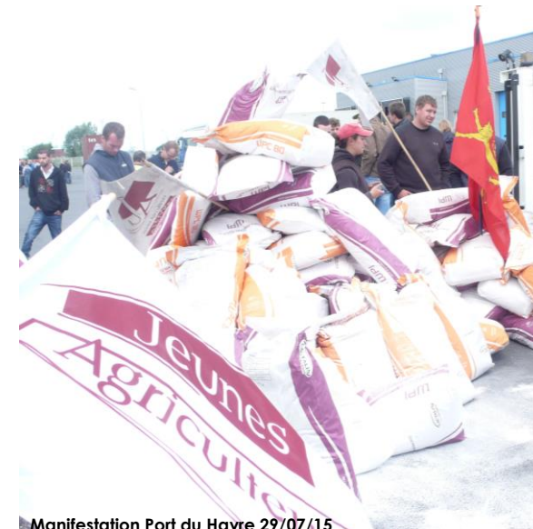
Manifestation Port du Havre 29/07/15