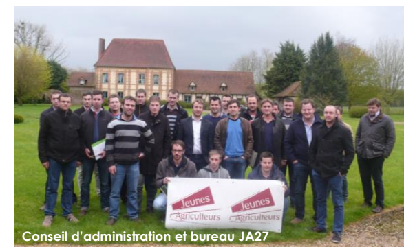
Conseil d'administration et bureau JA27